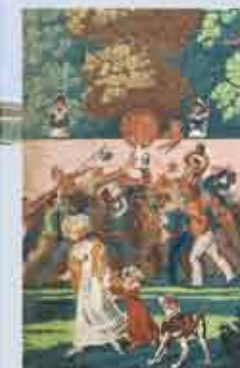
Papier peint panoramique (détail) Fêtes publiques parisiennes, manufacture Messener, Lapeyre & Cie, succ. de Velay, Paris, vers 1825