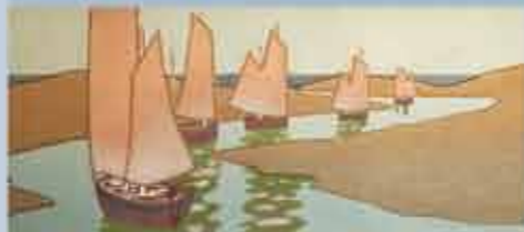
(détail) The Hale Bar, manufacture inconnue, Grande-Bretagne, N°24728, vers 1905, bordure imprimée à la planche et au pochoir

Few buildings in Haute Alsace have as much elegance as the Commanderie of Rixheim, constructed from 1735 to 1738 for the Teutonic Knights. It is in this exceptional scene that wallpaper has been manufactured since 1797 and where the museum opened its doors in 1983.