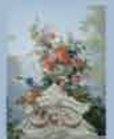
Décor Louis XVI, détail Manufacture Bezault & Pattey fils, Paris, 1867 Dessin de Jules Petit, traduit pour le papier peint par Victor Dumont Papier peint imprimé à la planche Ancienne collection Foliot, Paris

From June 1st to September 30th : Tuesday, Thursday and Saturday at 3.30 pm