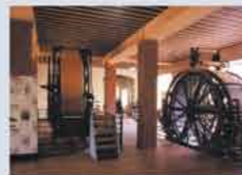
Salle des machines du musée, machines à imprimer en 12 et 16 couleurs ( 1877 et 1890 )