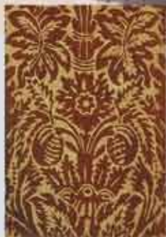
(détail) Atelier inconnu, France, vers 1720, tontisse sur toile