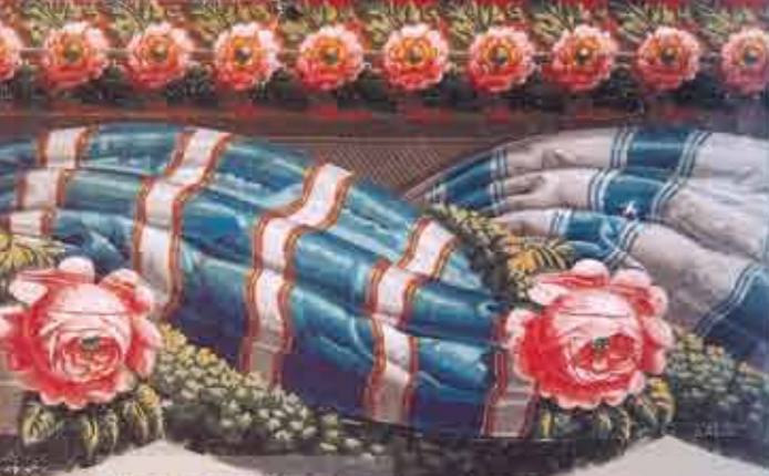
(détail) Manufacture inconnue, France, vers 1810, bordure de papier peint imprimée à la planche