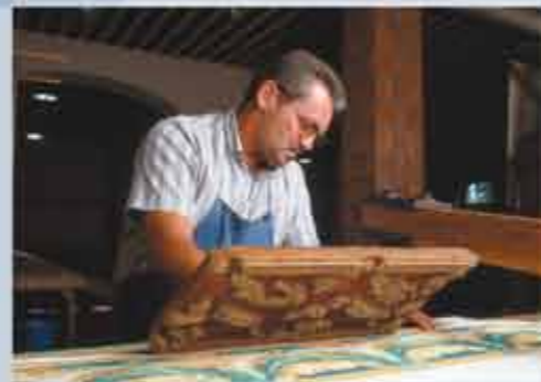
Impression à la planche d'une bordure de papier peint de 1861 lors d'une démonstration au musée

For two centuries now, wallpaper has been an element of decoration imparting one's ideas and taste regarding one's living environment. Its fascinating history involves over 200 years of technical study - from the craftsman's work to industrial process - and equally the study of men - rich or poor who utilized wallpaper as a «second skin». This unique collection comprises more than 130,000 documents from the 18th century to present day. The museum also displays archives and machines, allowing you to relive the history of wallpaper and to discover with a fresh look a world you may have thought well known.