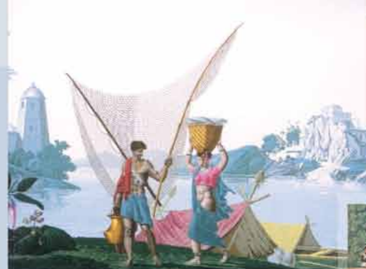
(détail) - L'Hindoustan, Manufacture Zuber & Cie, Rixheim, 1807, impression à la planche. Ce papier peint est toujours imprimé par la Manufacture Zuber & Cie avec les planches originales.

The machinery room presents step by step the production of wallpaper from the image to the printing blocks as well as a spectacular sixteen colors surface printing machine. During the summer season, this equipment operates in front of you enabling you to discover the work of the printer and the printing plates.